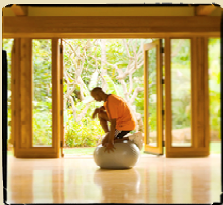
Egészség és Wellness

Egyszerre kovácsolhat tőkét az összes alábbi tevékenységből