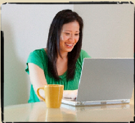
Otthoni üzleti tevékenység